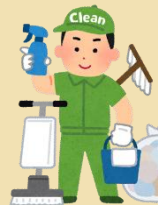
ビルクリーニング